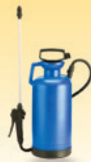
POMPA A PRESSIONE