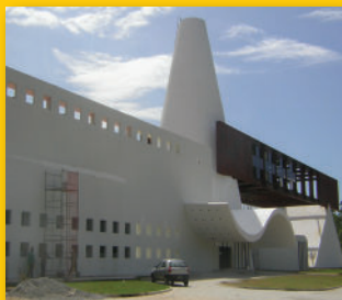
CENTRO RICERCHE - BRASILE -