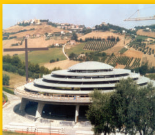
SALA CONVEGNI - ITALIA -