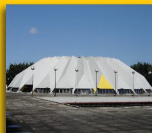
CENTRO CONGRESSI - BRASILE -