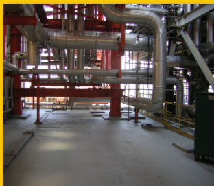
ENEL POWER - ITALIA -