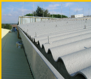
DEPOSITO - ITALIA -