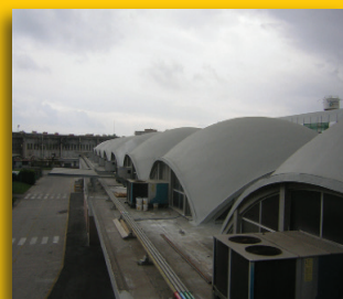
INDUSTRIA - ITALIA -