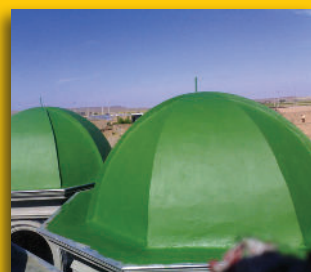
CUPOLE - IRAN -

La pulizia degli attrezzi va effettuata a prodotto fresco con acqua.