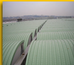
DEPOSITO - ITALIA -